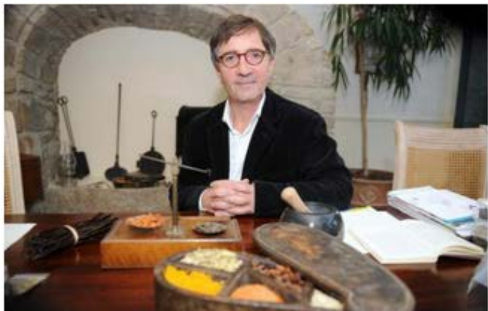
Le chef Olivier Roellinger pose au Château Richeux, à Cancale, le 25 février 2010