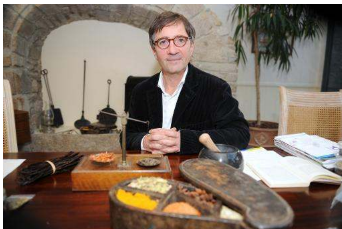
Le chef Olivier Roellinger pose au Château Richeux, à Cancale, le 25 février 2010

Paris (AFP) – Soutenue par plusieurs chefs comme Olivier Roellinger, une association vient de se créer pour encourager les restaurateurs à contribuer à la lutte contre le réchauffement climatique.